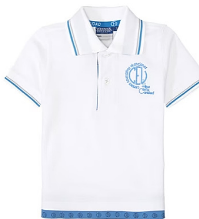
Polos de uniforme