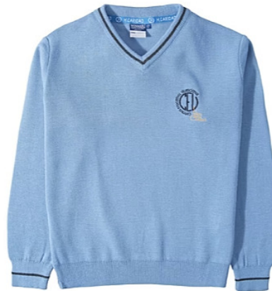
Jersey de uniforme