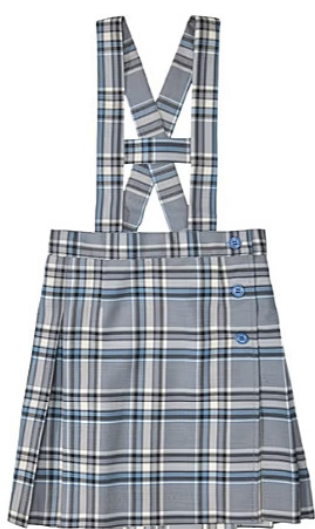
Falda y pantalón de uniforme