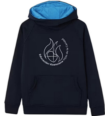
OPCIONAL Sudadera de uniforme