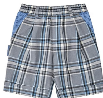
OPCIONAL Bermuda de uniforme (Solo en E. Infantil)