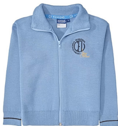
Chaqueta de uniforme