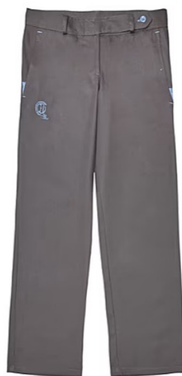
Pantalón de uniforme