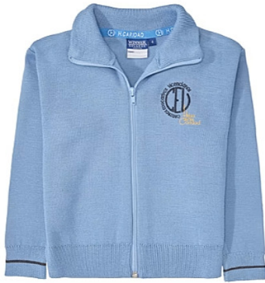
Chaqueta de uniforme