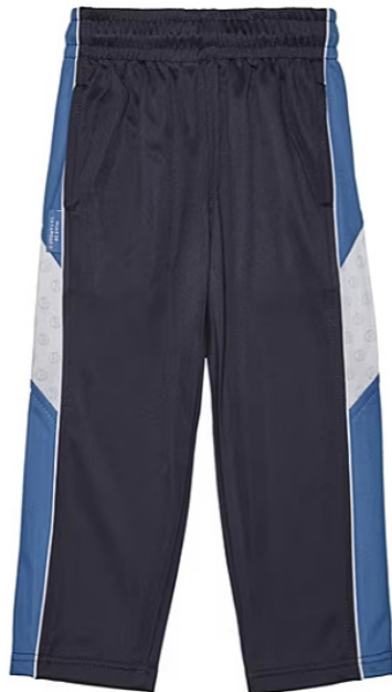
Pantalón de chándal