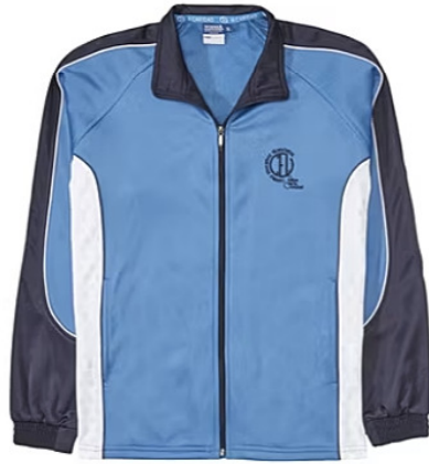
Chaqueta de chándal