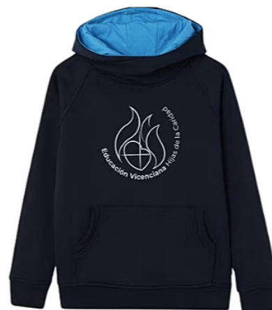
OPCIONAL Sudadera de uniforme (a partir de 5° E. Primaria)